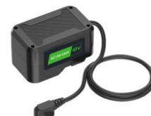
BC-18 Pasuje do 2F0BR, 2F1BR Dostępny opcjonalnie