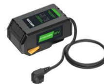
BC-18P Pasuje do F2BR, 2F2BR Dostępny opcjonalnie