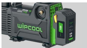
Zasilane z akumulatora