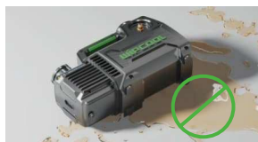
Ochrona przed wyciekami oleju