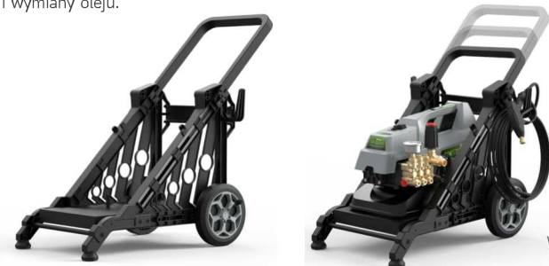
Wózek dostępny jako opcja.